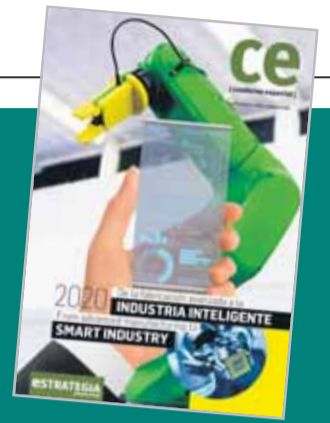
[ CUADERNO ]

do. Para ello buscará distribuidores, mientras que en España lo seguirá realizando junto a su matriz Leku-Ona Global Solutions. [P 2-3]