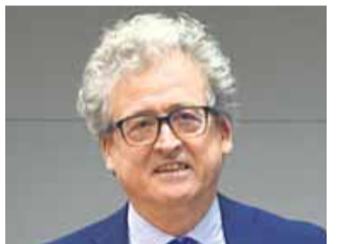
* LA FIRMA

Euskadi acelera para evolucionar de la fabricación avanzada a la industria inteligente