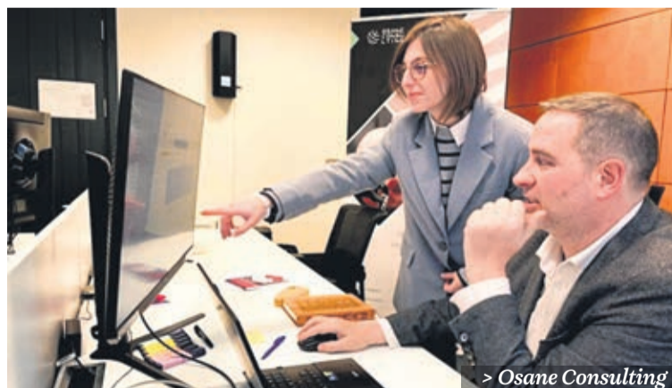
> Osane Consulting

Con más de 30 años en el mercado, la de Donosti Frame es una historia de evolución junto a las nuevas tecnologías: desde las infografías 3D con las que arrancó, hasta la actualidad, en la que implementa herramientas de metaverso en el marketing audiovisual. PÁG. 15